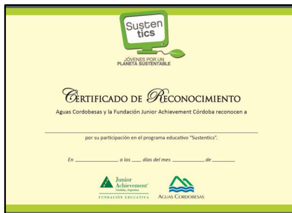
Certificado de Participación