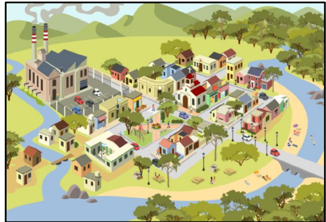
Imagen de la ciudad luego de tomar decisiones