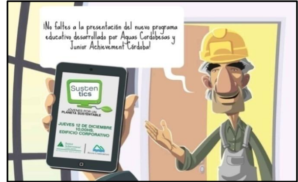
Personajes del programa que plantean las situaciones sobre las cuales tomar decisiones