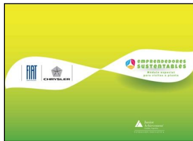
Manual del Voluntario y del Alumno