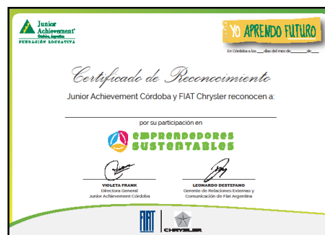
Certificado de participación

mayo en Tanti (Provincia de Córdoba, Argentina). Una semana de conferencias, competencias, talleres, actividades de grupo y deportivas, fiestas temáticas y la convivencia con diferentes culturas, conforman el mejor FORO para jóvenes emprendedores del mundo.